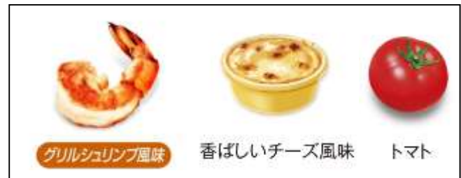
『ベルキューブ スプリングセレクト』の3種のフレーバー