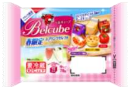
『ベルキューブ スプリングセレクト』パッケージデザイン